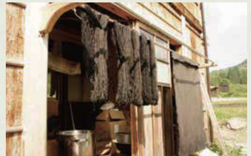
※井普請がなければ、こちらで藍立ての作業を体験させていただきます。

野良着ひとつにも地域特有のものがあります。股にゆとりがあり、体を動かす仕事に最適な「たつけ」は、1枚の布からゴミが出ないように設計されているのだとか。伝統を受け継ぐヒントをここで伺います。