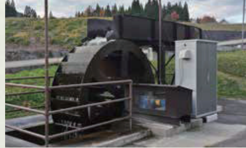
◀農産物加工品の生産に使う上掛け水車