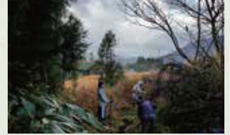
※井普請は地域の行事の日程次第で行わない場合があります。

時期があれば、発電に利用する水路掃除のお手伝いをします。井普請（共同作業）に加わることで、少しだけ地域に参加しましょう。